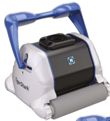
Spazzola a spugna