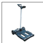
Caddy inclus Le chariot permet de déplacer et de stocker le robot rapidement et en toute simplicité.