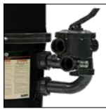
Valvola a 6 vie venduta separatamente SP0715XR50E