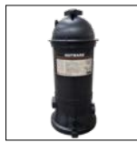
Contenitore per il recupero delle diatomee C09002SEP