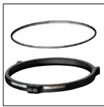
Questo collare elimina i rischi di un errato allineamento quando si monta il filtro