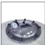
Ampio coperchio trasparente per una facile manutenzione