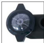
Coperchio con apertura a un quarto di giro per facilitare la manutenzione