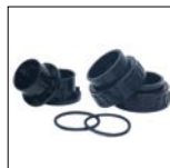
Raccordi di collegamento forniti in dotazione (50 e 63 mm)