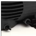
Doppio scarico, apertura facilitata senza uso di attrezzi