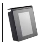
Écran tactile déportable