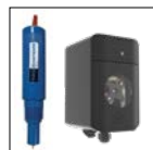
Kit ORP (Goldline)