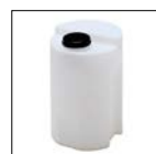
Stockage du dépôt-dosage