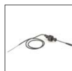
Détecteur de débit inclus