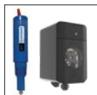
Kit pH (Goldline)