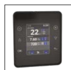
Écran TFT déportable