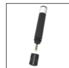
Sonde à membrane de mesure du chlore libre