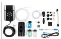
Kit pH (standard)