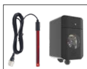
Kit ORP (standard)