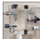
Sonde ampérométrique de mesure du chlore libre